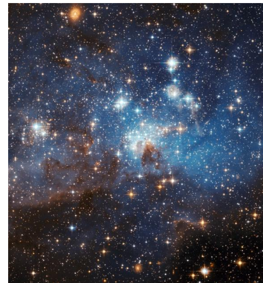
petite galaxie satellite de notre voie lactée

Année Universitaire 2022-2023 2ème et 3ème trimestres