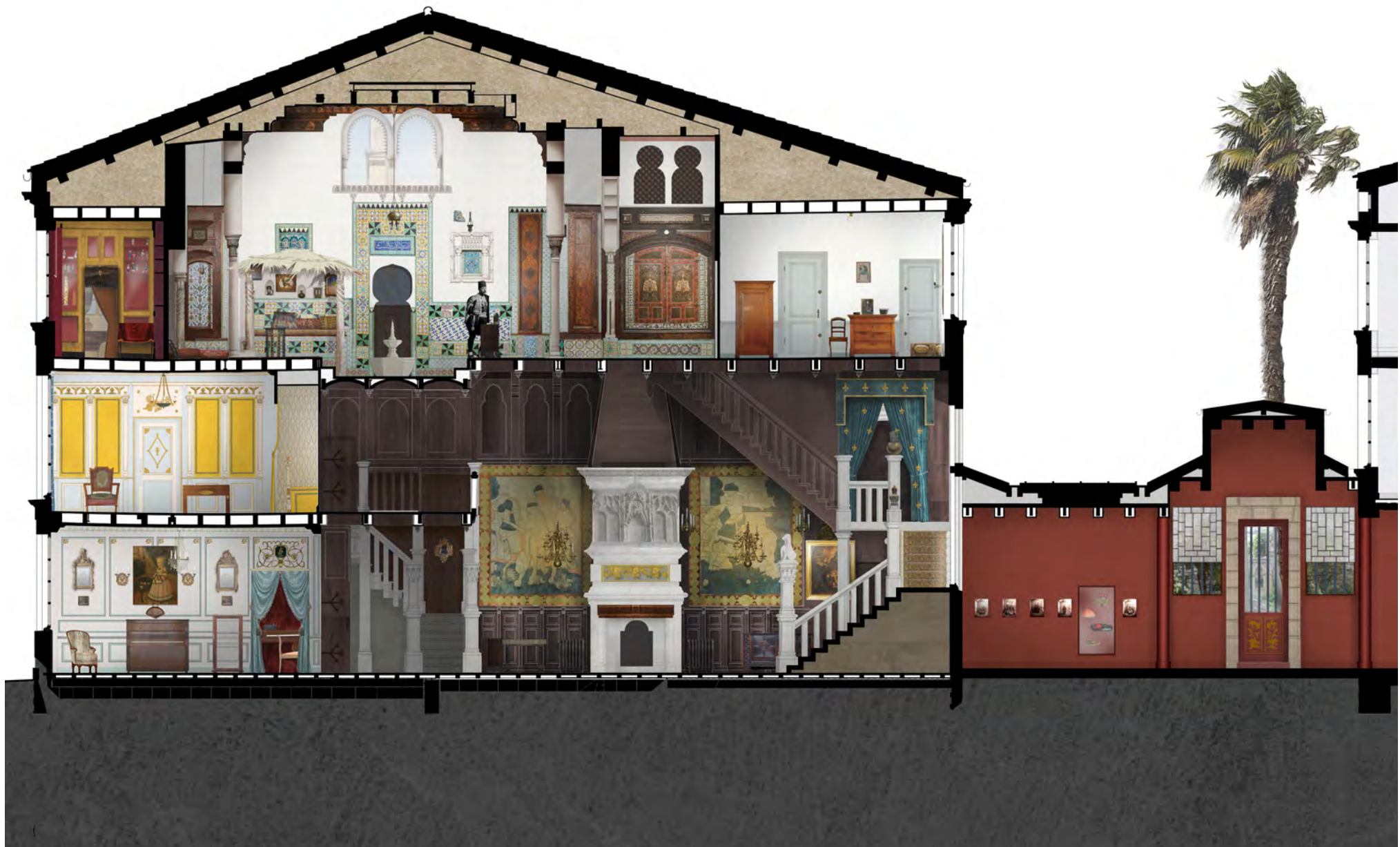
Ensemble de la maison : projet de restauration.