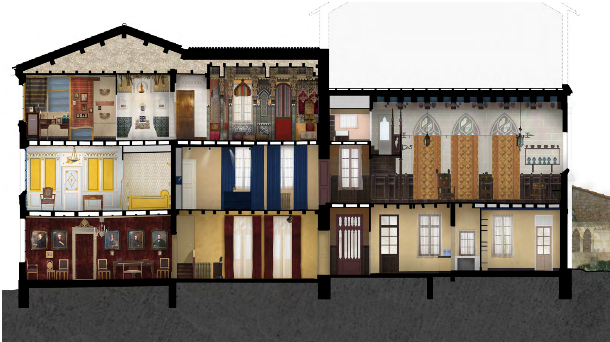
Ensemble de la maison : projet de restauration. © Sunmetron